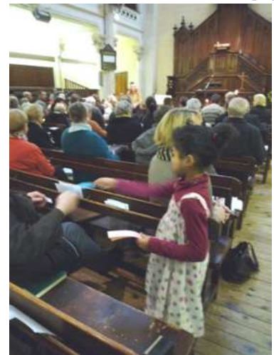
Passage de témoin