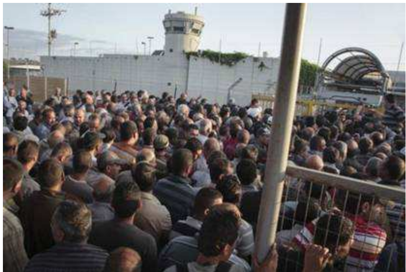
juillet 2013