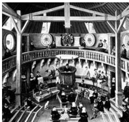
Le temple du Paradis (1564-1567), Lyon